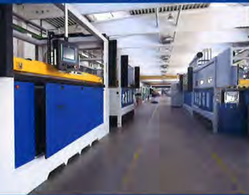
Hightech aus Bayern: Thermoformmaschine