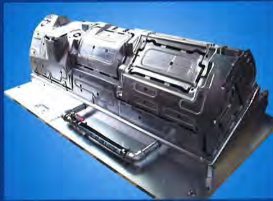
Weltweit gefragt: Form für Armaturenbrett