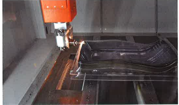
Laserschneiden von Konturen eines Schlittens aus 4 mm dicken PMMA-Platten mit einem Vorschub von 10000 mm/min bei einer Laserleistung von 950 Watt

deren Komponenten und Dimensionen an, sodass theoretisch jede Maschine, die das Unternehmen verlässt, ein Unikat ist. Um derart flexibel fertigen zu können, verzichtet Geiss auf den Einsatz von Normprofilen und verarbeitet stattdessen für die Gestelle der Anlagen Stahl- und Aluminiumbleche, die in den eigenen Hallen maschinenspezifisch geformt werden. Trotz der sehr stark kundenspezifischen Fertigung erreicht das Unternehmen kurze Durchlaufzeiten und wirbt damit, von der Auftragserteilung bis zur Auslieferung nur sechs Wochen zu benötigen.