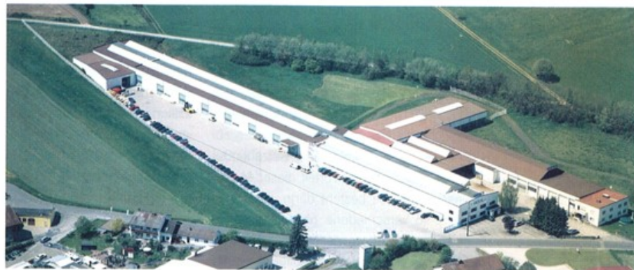
Das 2005 in Betrieb genommene neue Werk in Seßlach ist ganz auf die modernen Produktionsabläufe zugeschnitten