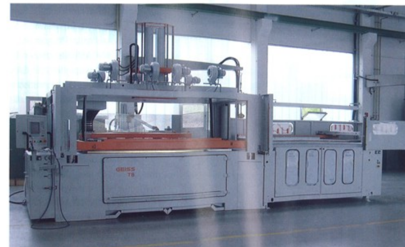
Geiss entwickelte in den 1950er Jahren die erste Thermoformmaschine – heute verlassen jährlich 120 Maschinen die Produktion – allesamt Unikate