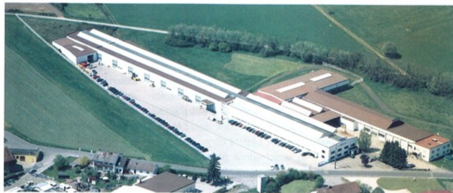
Das 2005 in Betrieb genommene neue Werk in Seßlach ist ganz auf die modernen Produktionsabläufe zugeschnitten